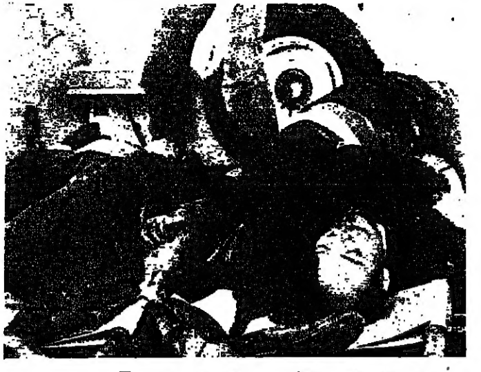
جئت ثلاث قلى داخل سيارة اسعاف امس

دائرة اعلانات دار الصياد بسبب الاحداث الراهنه انتقلت دائرة اعلانات دار الصياد مؤقتاً الى العازمية. تبرحو اصحاب الملاقة الاتصال على ارقام هاتف : ٤٥٢٧٠٠ و ٤٥٠٩٣٣